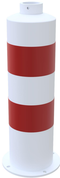
Inselfosten Typ 44170B -ortsfest-