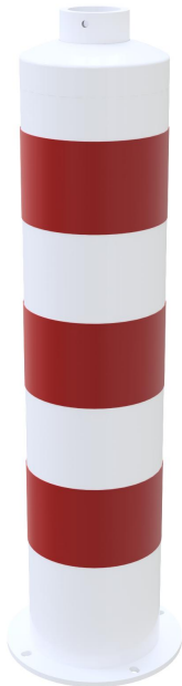
Inselfosten Typ 44171B -ortsfest-