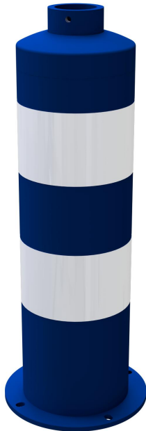
Inselfosten Typ 44170BB -ortsfest-