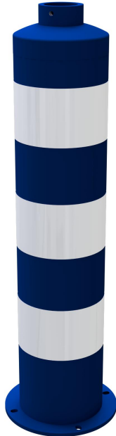
Inselfosten Typ 44171BB -ortsfest-