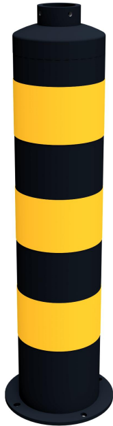
Inselpfosten Typ 44171BG -ortsfest-