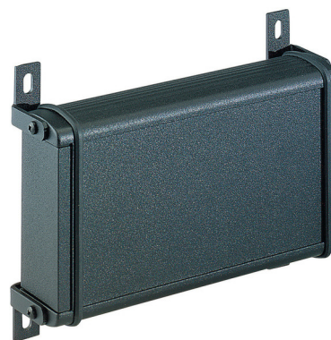
Abbildung: Optionale Wandhalterung