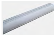
AT 706 - N728030 Baum rund Durchmesser 70 mm Länge 6,35 m für MICHELANGELO. Für Durchfahrten bis zu 6 m