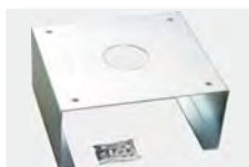
BM - D730964 Fundamentplatte für Schranken der Serie MICHELANGELO