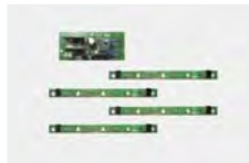
KIT MCL LAMPO - P120006