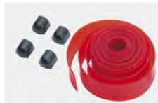
PCA N6 - P120028 00004 Unteres und oberes Gummiabdeckprofil für Bäume max. 6 m