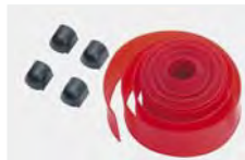
PCA N3 - P120028 00001 Unteres und oberes Gummiabdeckprofil für Bäume max. 3 m