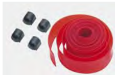
PCA N5 - P120028 00003 Unteres und oberes Gummiabdeckprofil für Bäume max. 5 m