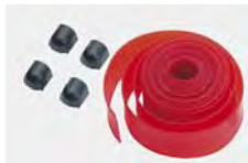
PCA N8 - P120028 00005 Unteres und oberes Gummiabdeckprofil für Bäume max. 8 m