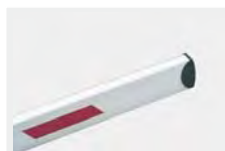
AQ6 - N728022 Baum Rechteckprofil 6 m aus einem Stück für MICHELANGELO