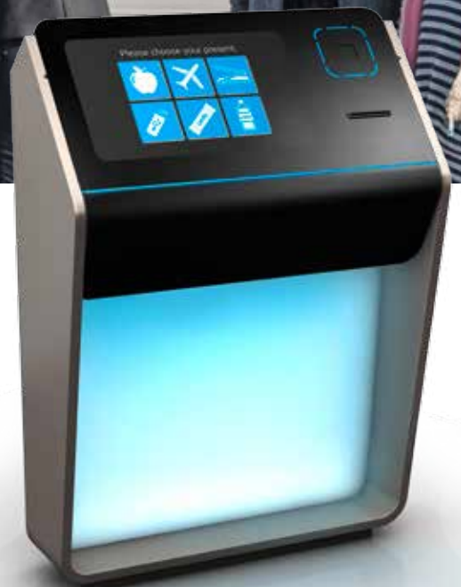
Automat mit Bondrucker

■ Mit Trolley Return kann künftig auf das Münzpfandsystem verzichtet werden, da die Rückgabe der Einkaufswagen über ein Bonussystem gesteuert wird. Dabei sind unterschiedliche Belohnungsmodelle denkbar: Spende für einen guten Zweck, der Ausdruck eines Bons für den nächsten Einkauf oder die Teilnahme an einem Gewinnspiel. Grundsätzlich wird der Wagen von einem RFID-Reader elektronisch erfasst, wenn er in die Parkbox oder Sammelstation zurückgebracht wird.